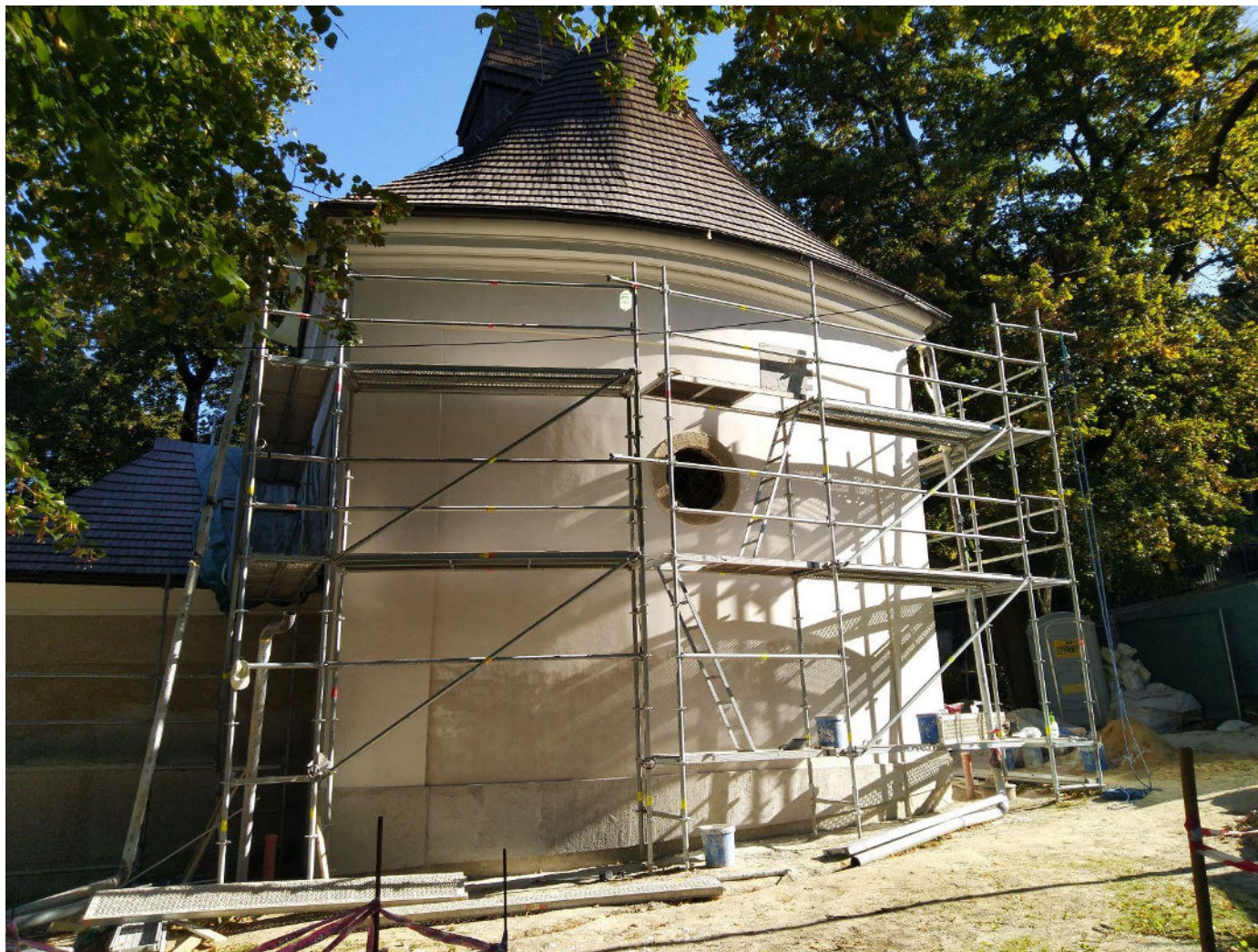
Pohľad na novú fasádu zo zadnej strany presbytéria