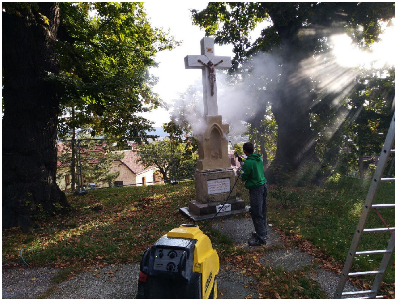
Čistenie kamenného kríža pred Kaplnku vysokotlakým prúdom zmesi vody a pary