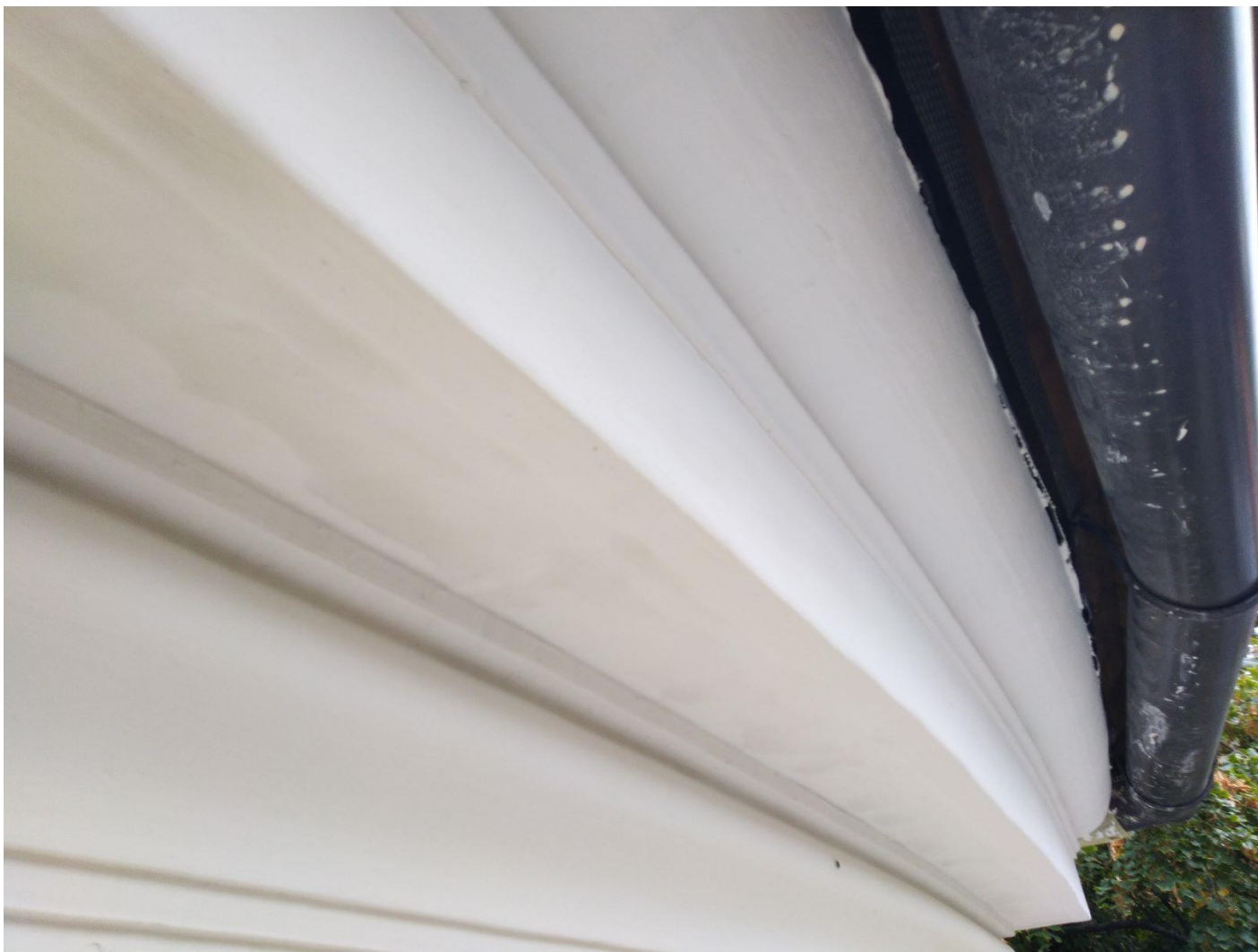
Pohľad na pásovú výzdobu korunnej rímsy presbytéria s aplikovanou štukovou omietkou.