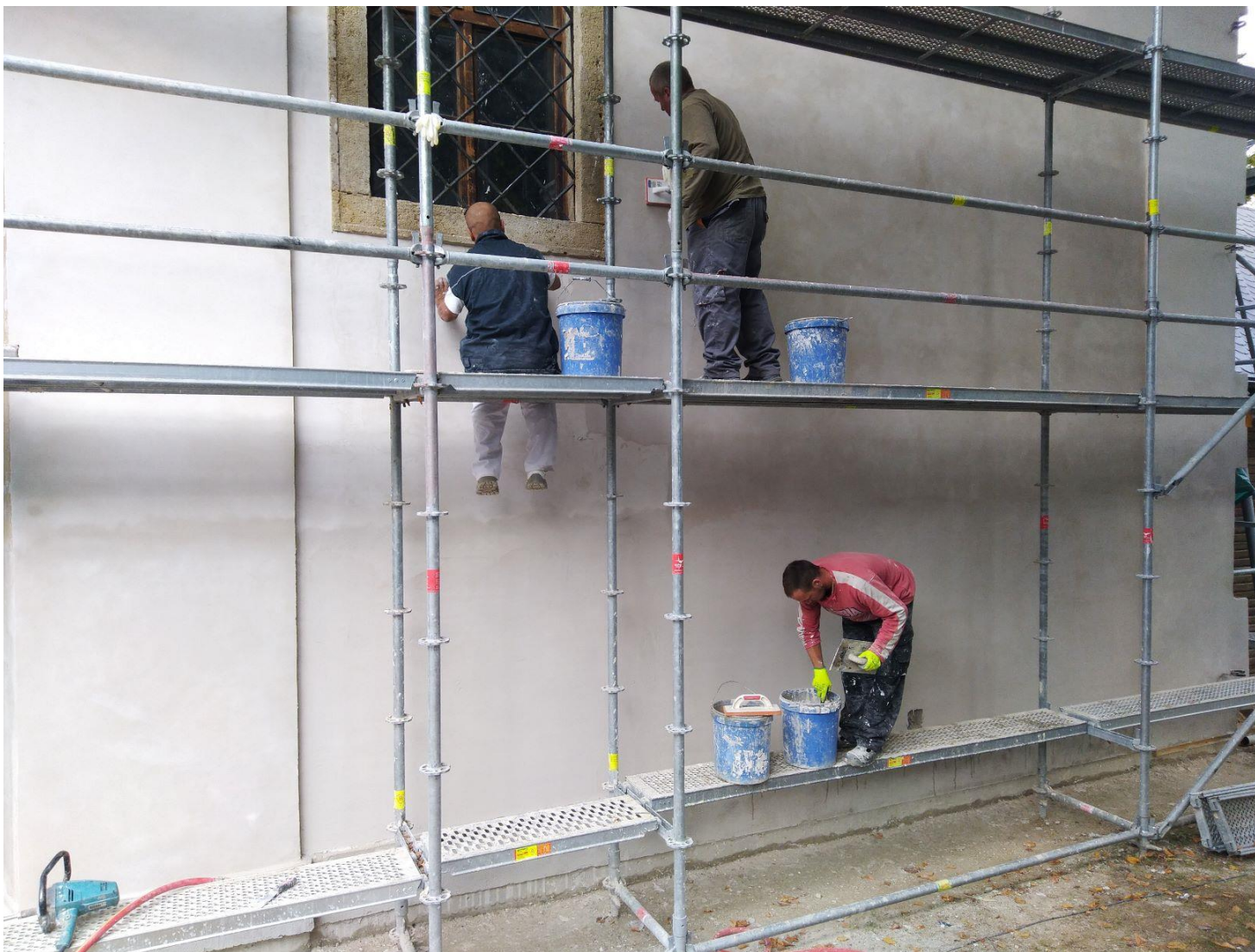
Začistovanie povrchu fasády jemným štukom