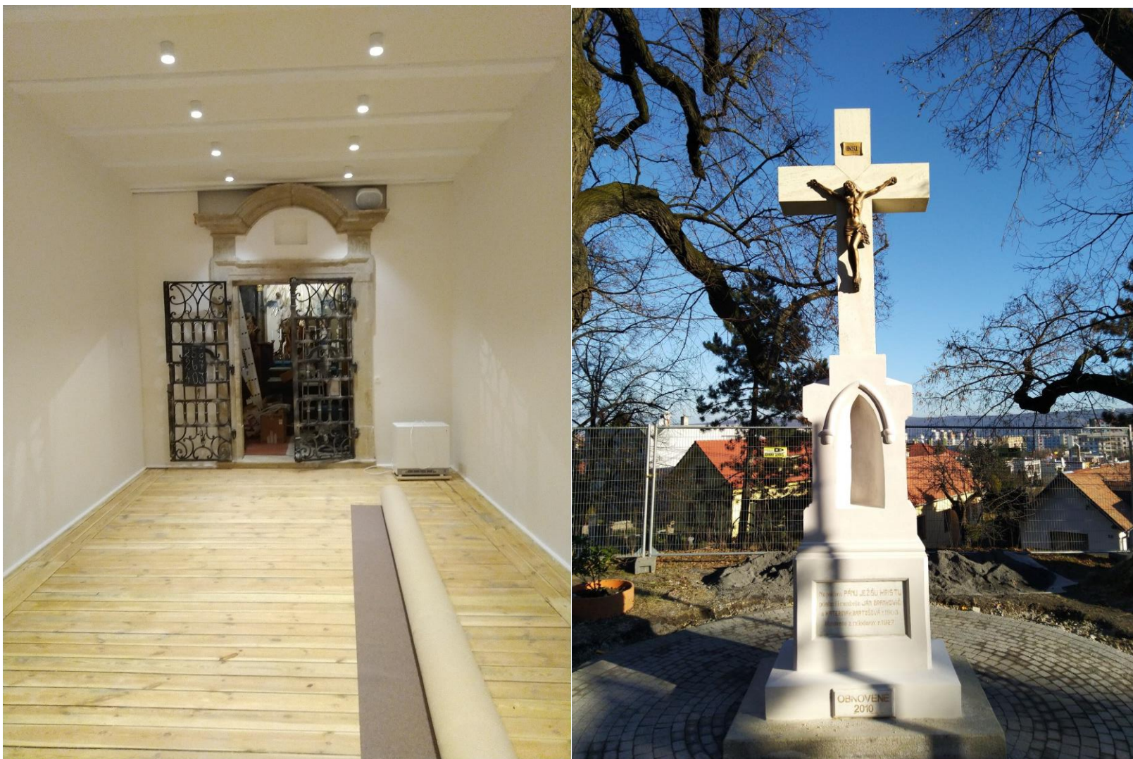
Prístavba po maľovke, vybrúsení podlahy – pred kladením nového koberca. Nanovo zreštaurovaný kríž pri kaplnke.