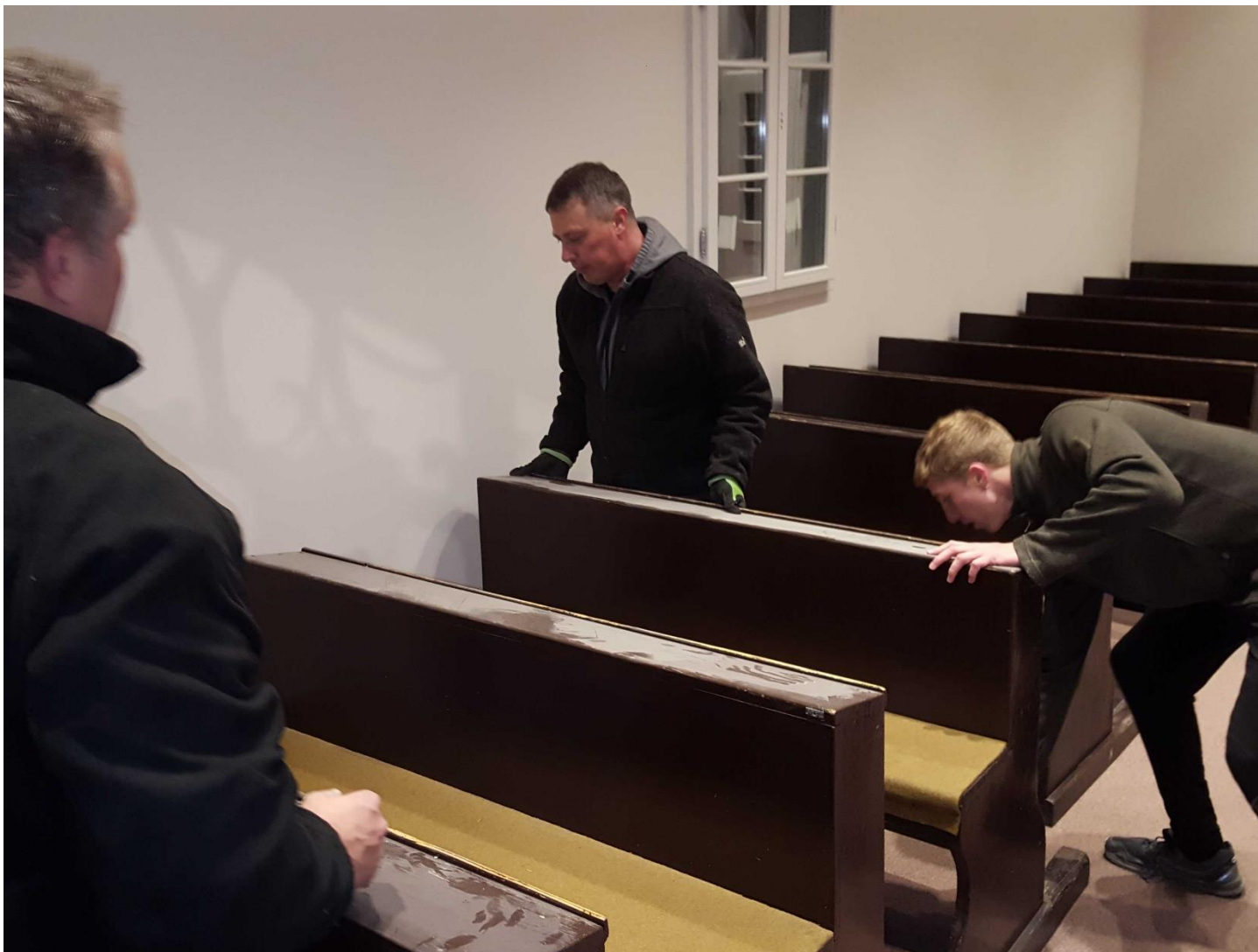
Pri sťahovaní mobiliáru do prístavby nestál bokom ani pán farár.