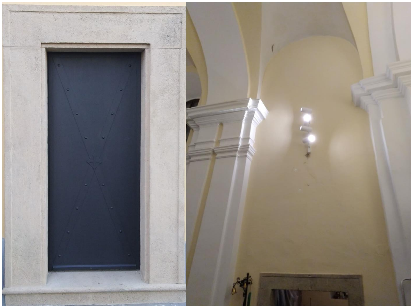
Nové sakristiové dvere s oplechovaním a dobovým vzorom. Nové svietidlá v presbytériu.