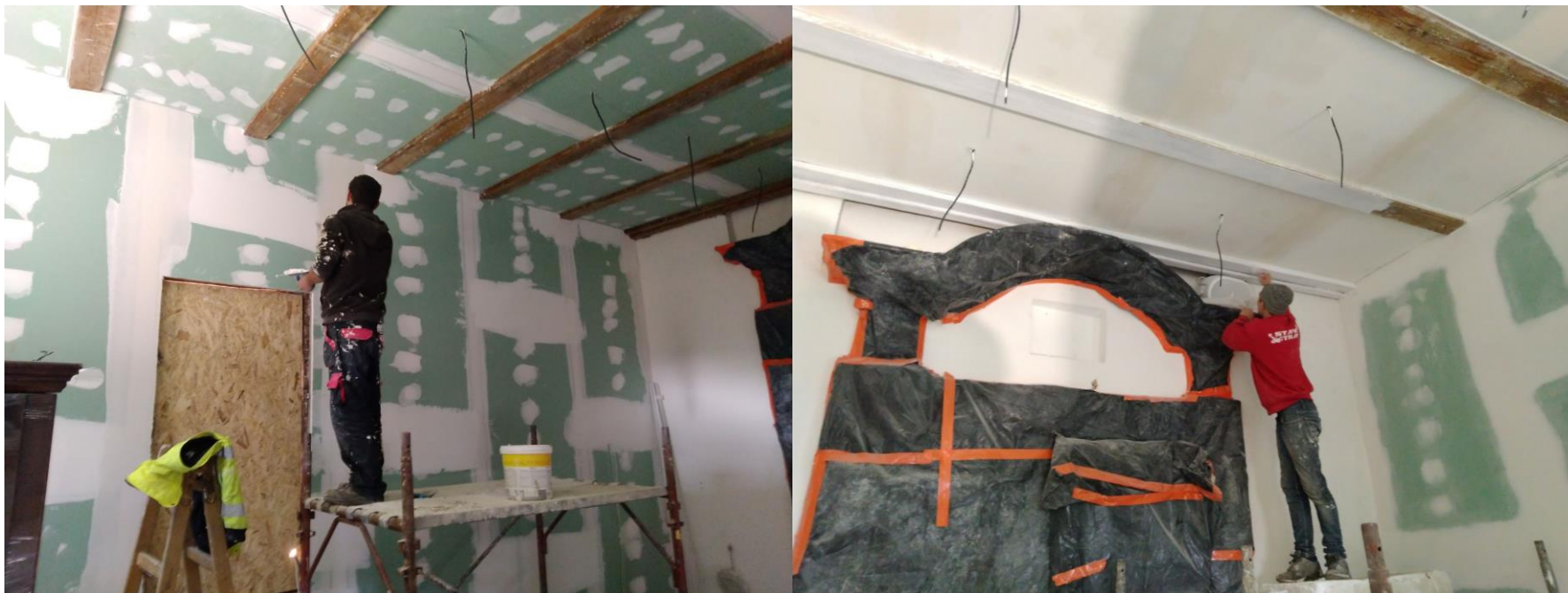
Finalizácia sadrokartónového obkladu interiéru kaplnky, maľba stien.