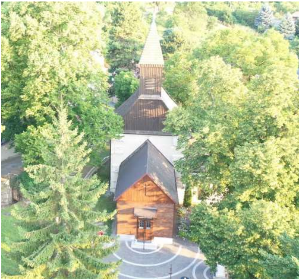
Kaplnka Ružencovej Panny Márie v súčasnosti