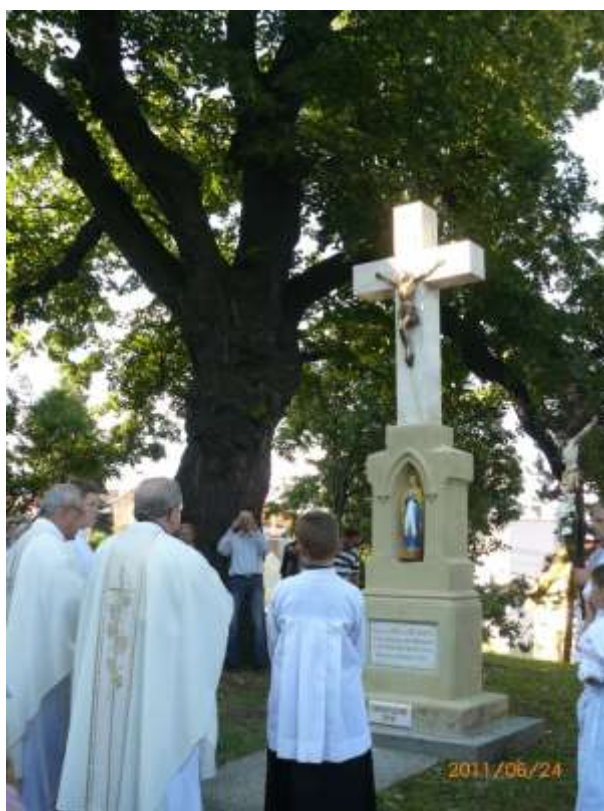
Požehnanie obnoveného kríža 24.6.2011