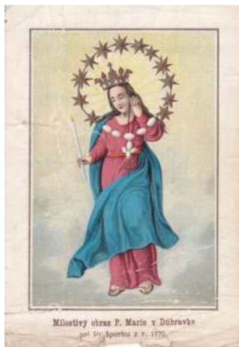
Nápis na dobovom obrázku (okolo roku 1920), datuje oltárny obraz v kaplnke do roku 1770.