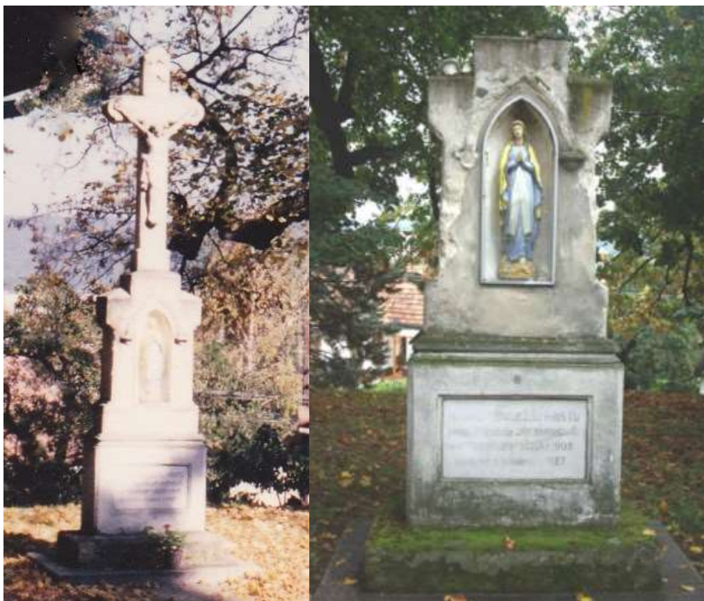
Kríž pred kaplnkou z roku 1903, vandalmi poškodený v roku 2000