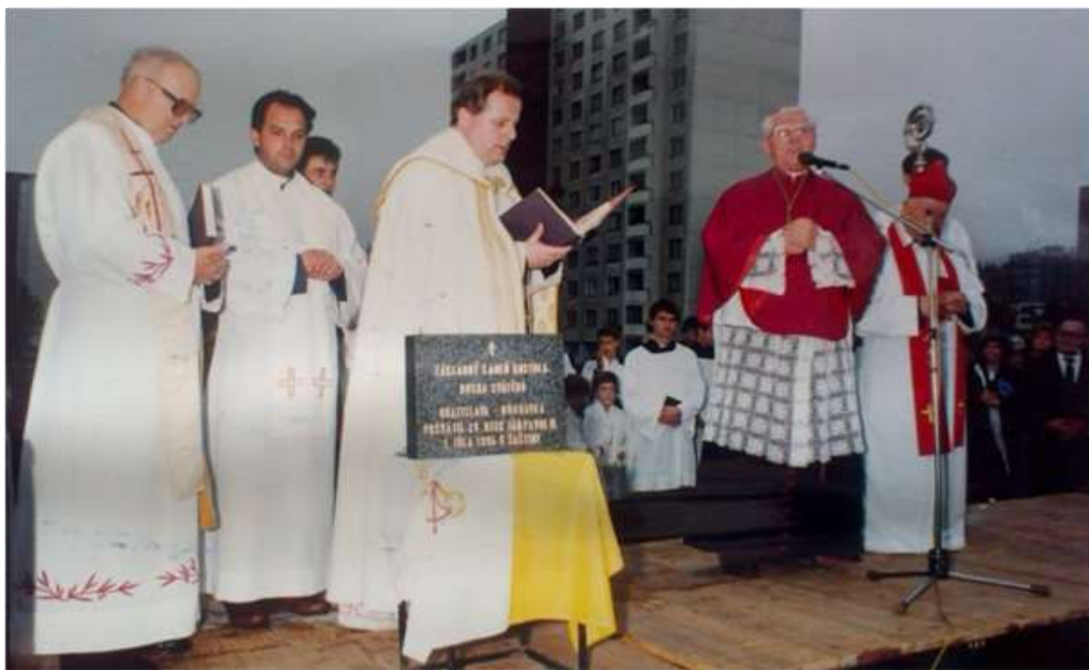
Požehnanie stavebného pozemku pod kostolom, 6.10.1996