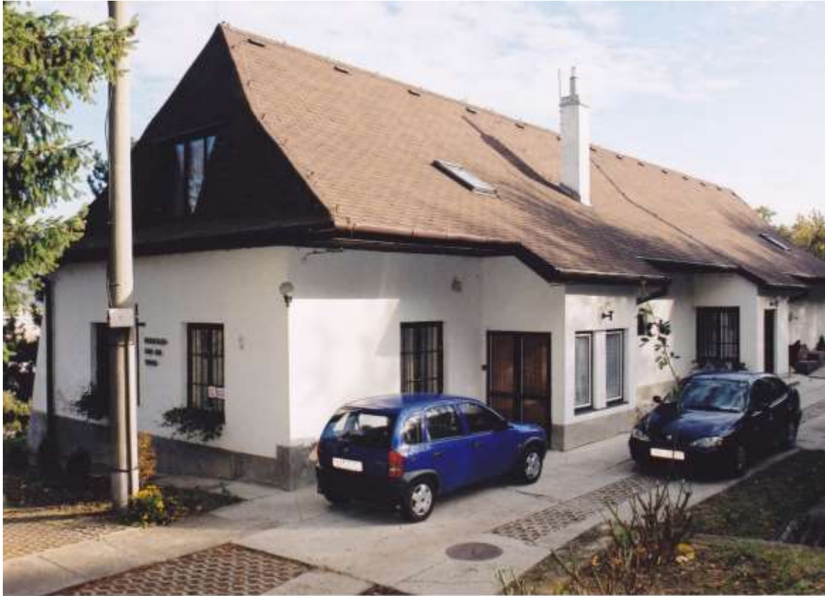
Predná časť budovy fary je z konca 18. Storočia, zadná bola pristavaná v roku 1994.