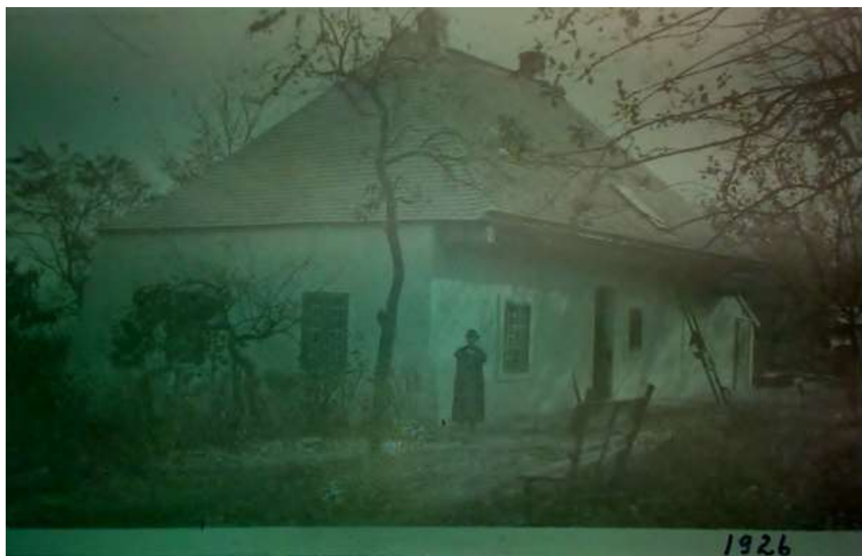
Budova fary v roku 1926