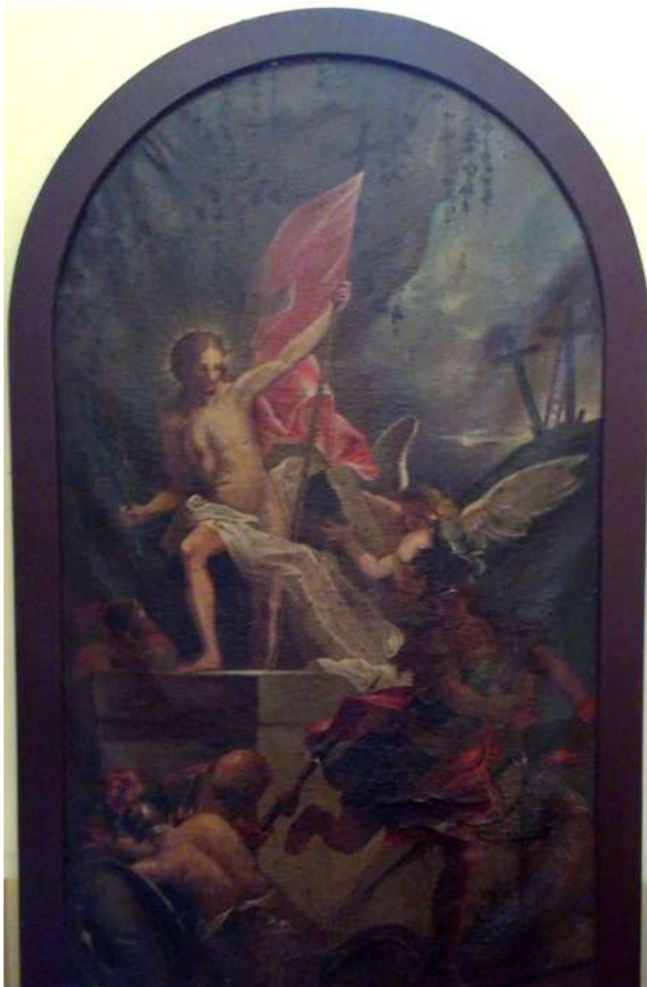
Zmŕtvychvstanie Pána, nedatovaný, od neznámeho autora, do roku 1991 na priečelí presbytéria

Napriek určitým „bielym miestam“ v archívoch týkajúcich sa predchorvátskeho obdobia Dúbravky a jej farského kostola, je možné s potešením konštatovať veľkú miery zhody naratívnej dochovanej i vedecky prebádanej histórie. Napriek pretrvávajúcej výzve – doplniť túto chýbajúcu časť na podklade seriózneho výskumu historikov i archeológov, zostane zatiaľ časť histórie Dúbravky tajomstvom takým, ako je človek sám.