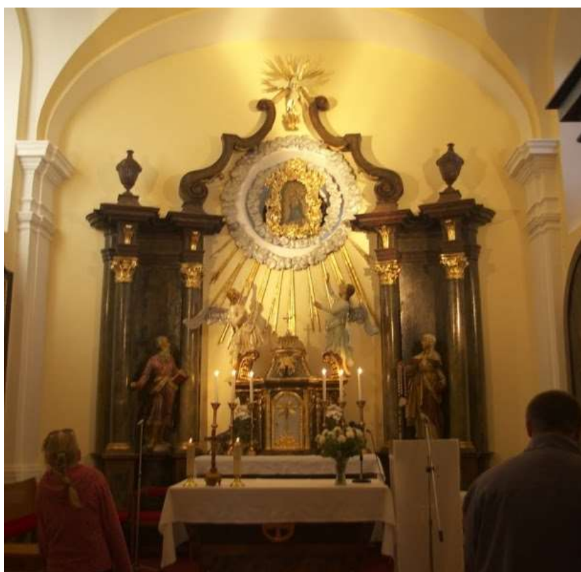
Interiér presbytéria kaplnky. Vo výklenkoch barokového oltára sú umiestnené sochy stvárňujúce rodičov Panny Márie - sv. Joachima a sv. Annu