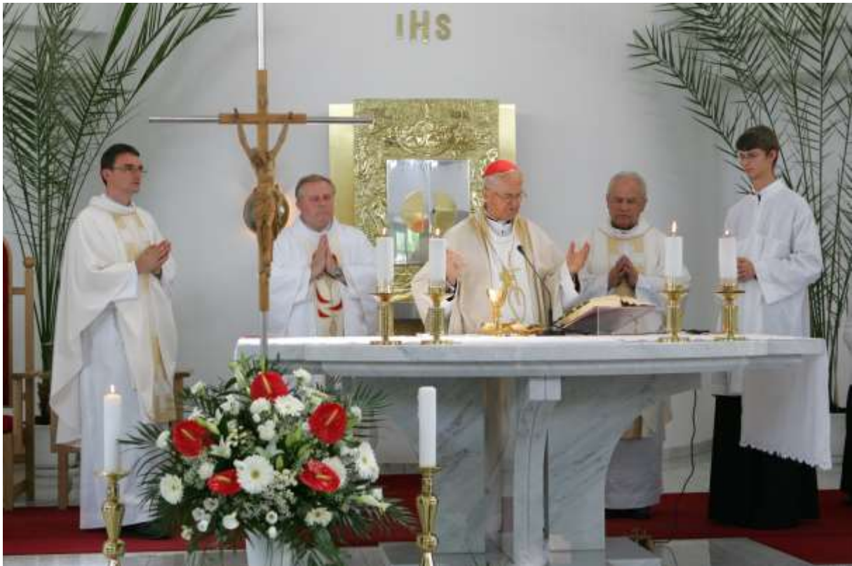
Dňa 7.6.2009 slávil v Kostole Ducha Svätého slávnostnú svätú omšu kardinál Jozef Tomko.

Kostol Ducha Svätého sa za vyše 20 rokov svojej existencie stal katolíckym duchovným centrom Dúbravky. Jeho história je oproti jeho starším predchodcom síce krátka ale o to bohatšia a intenzívnejšia. Veríme, že pre budúce generácie nezostane len architektonickým objektom svojej doby, ale najmä trvalým duchovným žriedlom - z pohnutou históriou svojho vzniku, ducha naplňajúcou prítomnosťou a budúcnosť očakávajúcou nádejou.