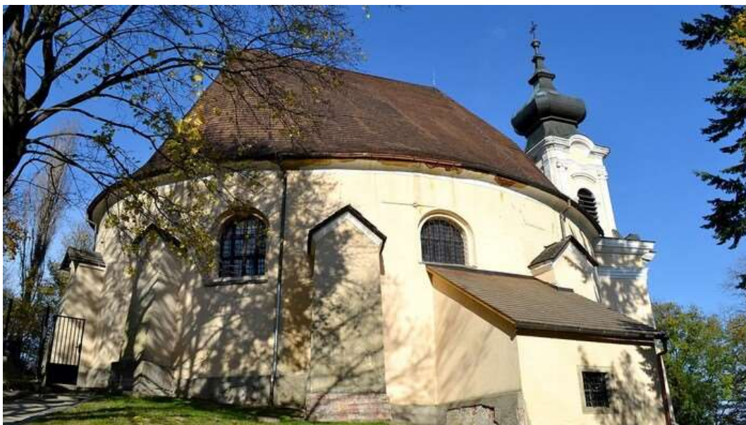
Farský kostol sv. Kozmu a Damiána, barokový z roku 1723