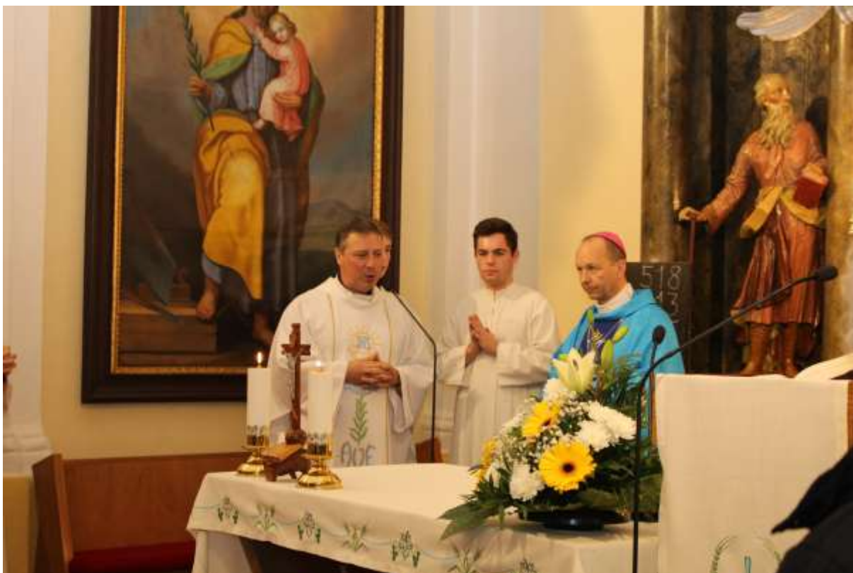
Posviacka kaplnky po generálnej obnove, 6.10.2022

Vzhľadom k nekonečnej rekonštrukcii farského kostola sv. Kozmu a Damiána, bola Kaplnka Ružencovej Panny Márie v rokoch 1983 až 1990 jediným bohoslužobným priestorom v Dúbravke. Toto isté negatívum však prinieslo aj bohaté ovocie v počte ľudí, ktorí ju pravidelne navštevovali a takto si popri návšteve bohoslužieb vytvorili aj pekný vzťah k tomuto miestu a jeho histórii. Tešíme sa, že kaplnka s okolitým parkom a Lurdskou jaskynkou boli v rokoch 2019-2021 postupne zrekonštruované do podoby, ktorá svedčí o vysokej kultúrnej úrovni obyvateľov mestskej časti a ich vzťahu k architektonickým a duchovným svedkom jej histórie.