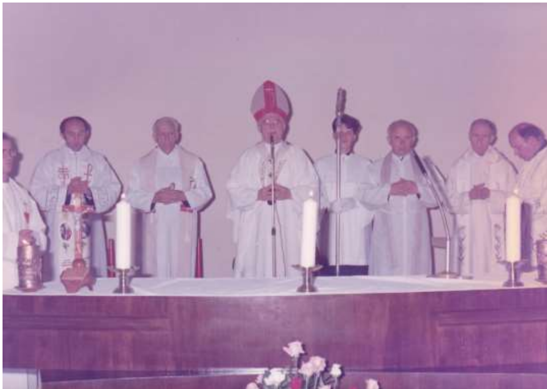
Slávnostná posviacka obnoveného kostola, 21.septembra 1991