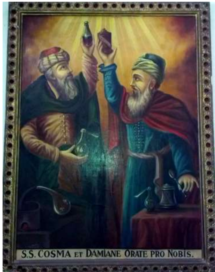
Sv. Kozma a Damián (do 1991 roku hlavný oltárny obraz), nedatovaný, od neznámeho autora.