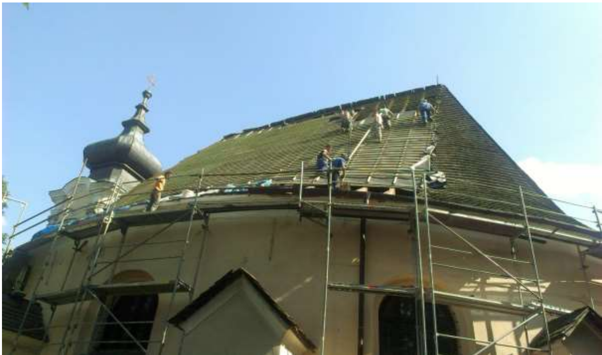
Práce na výmene šindľovej krytiny, máj 2014

Súčasný stav kostola (2023) je – najmä jeho exteriérová časť je značne opotrebená. Je potrebné realizovať opravu fasád a celkové architektonické doriešenie okolia, najmä rekonštrukciu prístupu na cintorín v jeho spodnej časti. Nakoľko je kostol Národnou kultúrnou pamiatkou, je celý proces prípravy jeho obnovy - od vypracovania Zámeru obnovy – až po realizačnú projektovú dokumentáciu pod dohľadom Krajského pamiatkového úradu v Bratislave. Obnova kostola bude logisticky i finančne náročná, preto bola rozdelená na tri etapy. V prvej etape (05-07/2014) bol rekonštruovaný krov a vymenená krytina strechy. V druhej bude riešené odstránenie zvlhňania základov a obnova fasády. V tretej bude realizovaná oprava vnútorných omietok, maľovky a dokončenie úprav v areáli kostola.