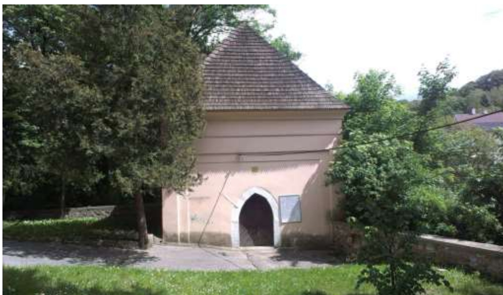
Kaplnka Sedembolestnej Panny Márie, ranorenesačná z 15. storočia

Z architektonicko-historického hľadiska bol jeho pôvod dosiaľ najpodrobnejšie popísaný v správe z archeologického výskumu, ktorý prebiehal v rokoch 1990-91. Závety výskumu boli publikované v roku 1993 v Zborníku Slovenského národného múzea: PhDr. Karel Prášek, Neznámy stredoveký kostol v Bratislave-Dúbravke . In. Zborník SNM LXXXVII - 1993 - Archeológia 3, str. 41 – 52. Z jeho obsahu vyberáme: