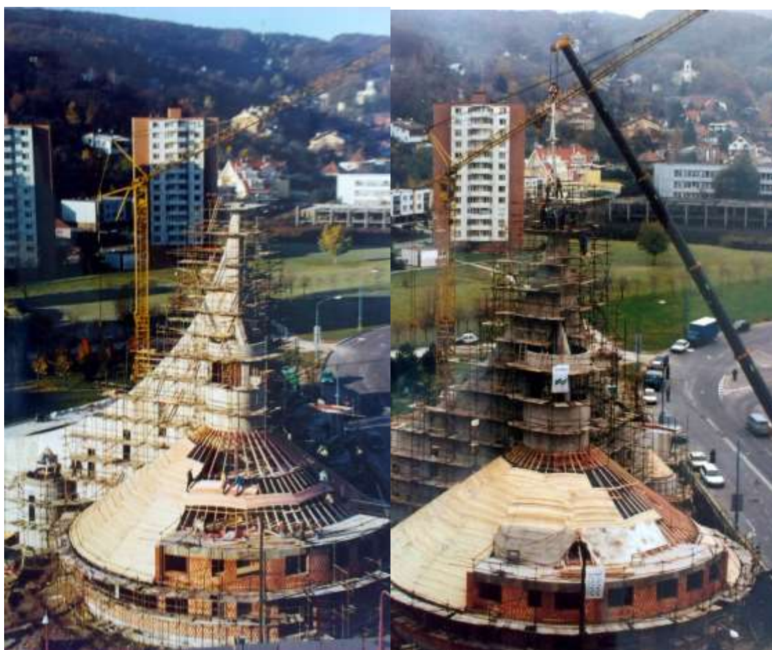
Postupný rast budovy nového kostola, 2000-2001. Transport posväteného kríža na vežu kostola 26.11.2001. V pozadí na kopci je vidno farský kostol – pod jeho „dohľadom“ stavba prebiehala.