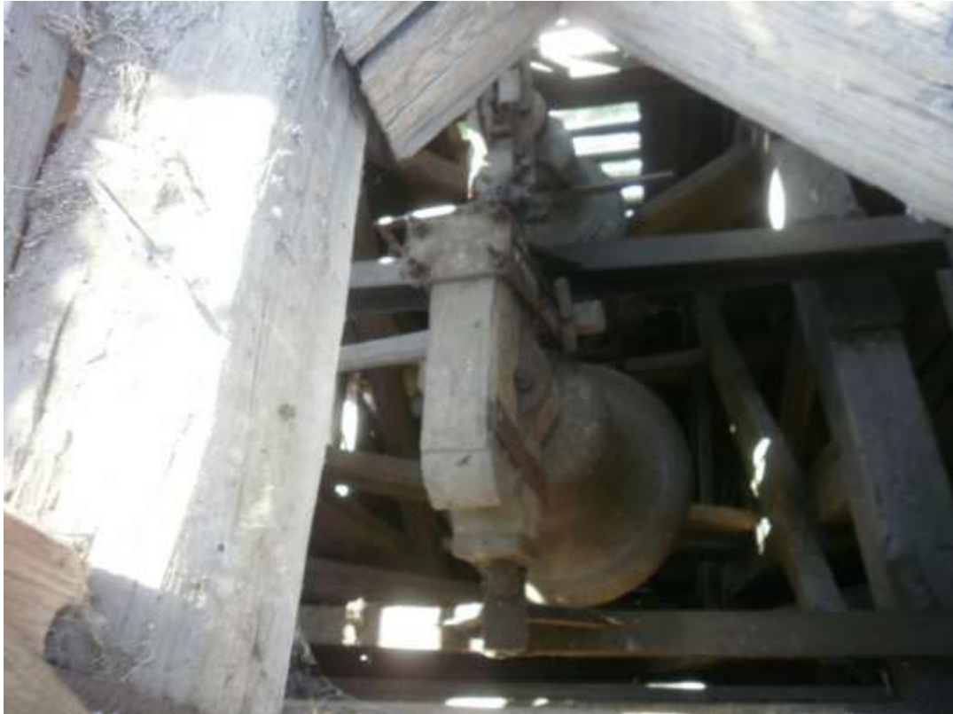
Zvony v kaplnke pred opravou