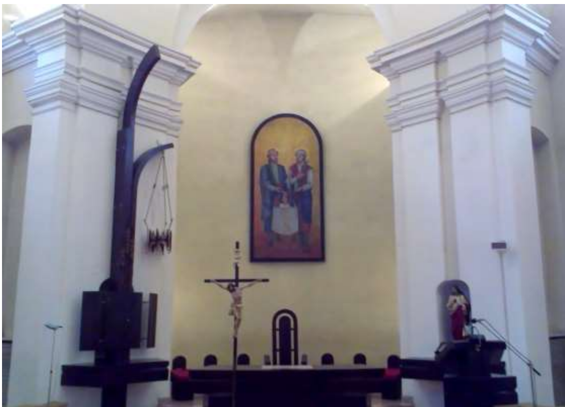
Presbytérium kostola po generálnej oprave. Bol vymenený aj hlavný oltárny obraz.