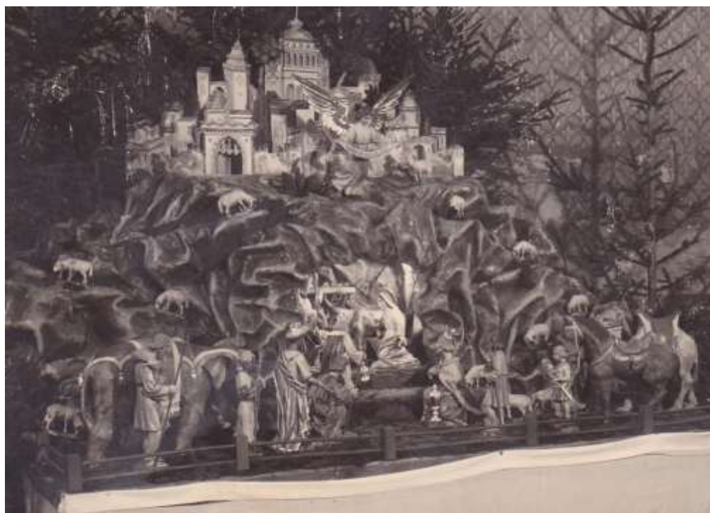
Betlehem s figúrkami z lipového dreva z roku 1948