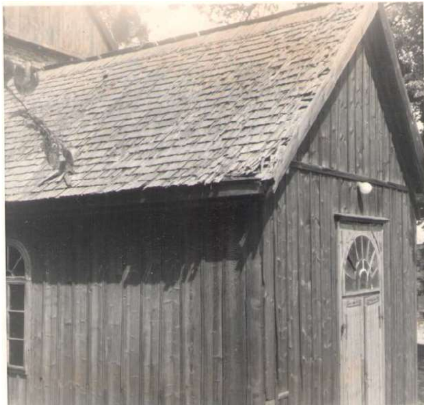
Drevená prístavba kaplnky v roku 1974 bola už v dezolátnom stave.