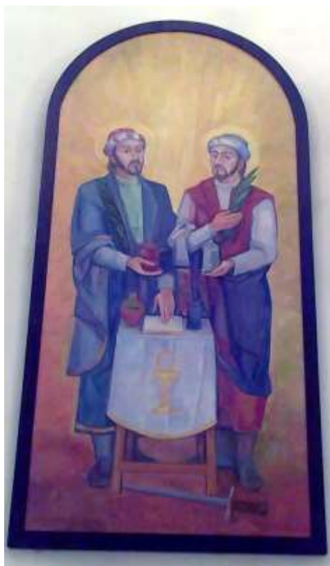
Detail nového oltárneho obrazu sv. Kozmu a Damiána, z roku 1991