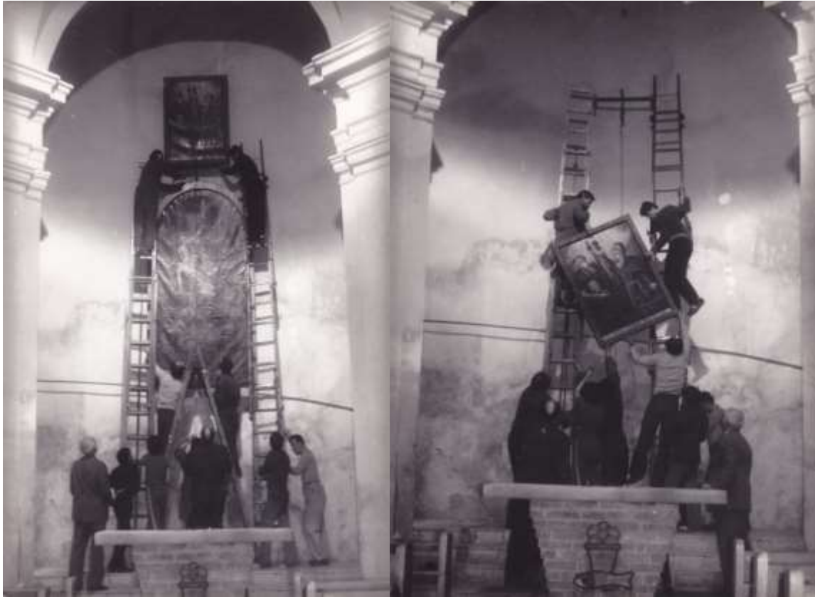
Demontáž oltárnych obrazov pred generálnou opravou – apríl 1983. Zavlhnutie stien kostola už dosahovalo výšku 4 metre. Murovaný obetný stôl z roku 1965 bol po roku 1983 zbúraný a v roku 1991 nahradený novým z dreva na mramorovom podstavci.