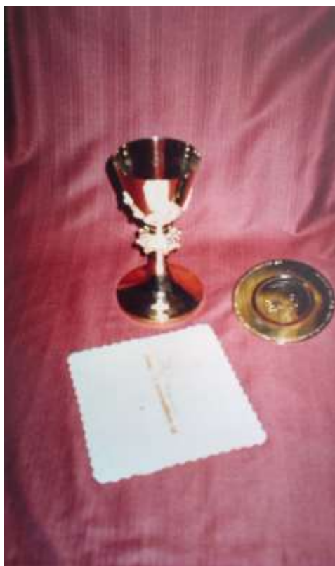
Dar pápeža Jána Pavla II pre nový kostol – kalich s paténou, odovzdal apoštolský nuncius.