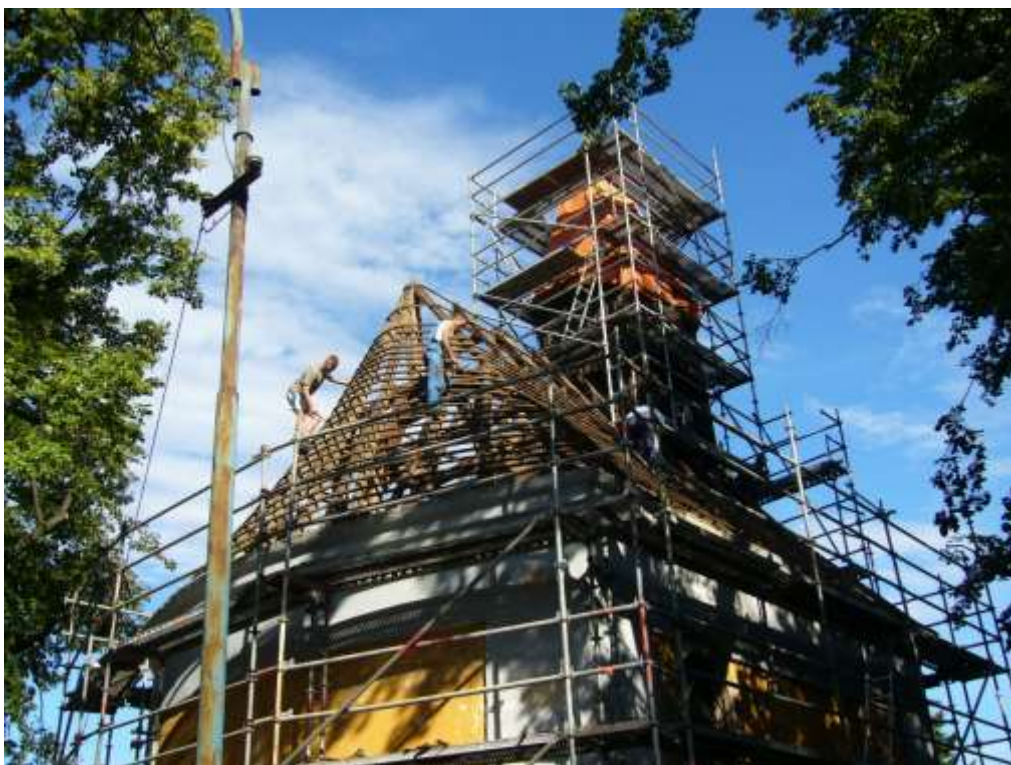
Demontáž krovu a věže v auguste 2010