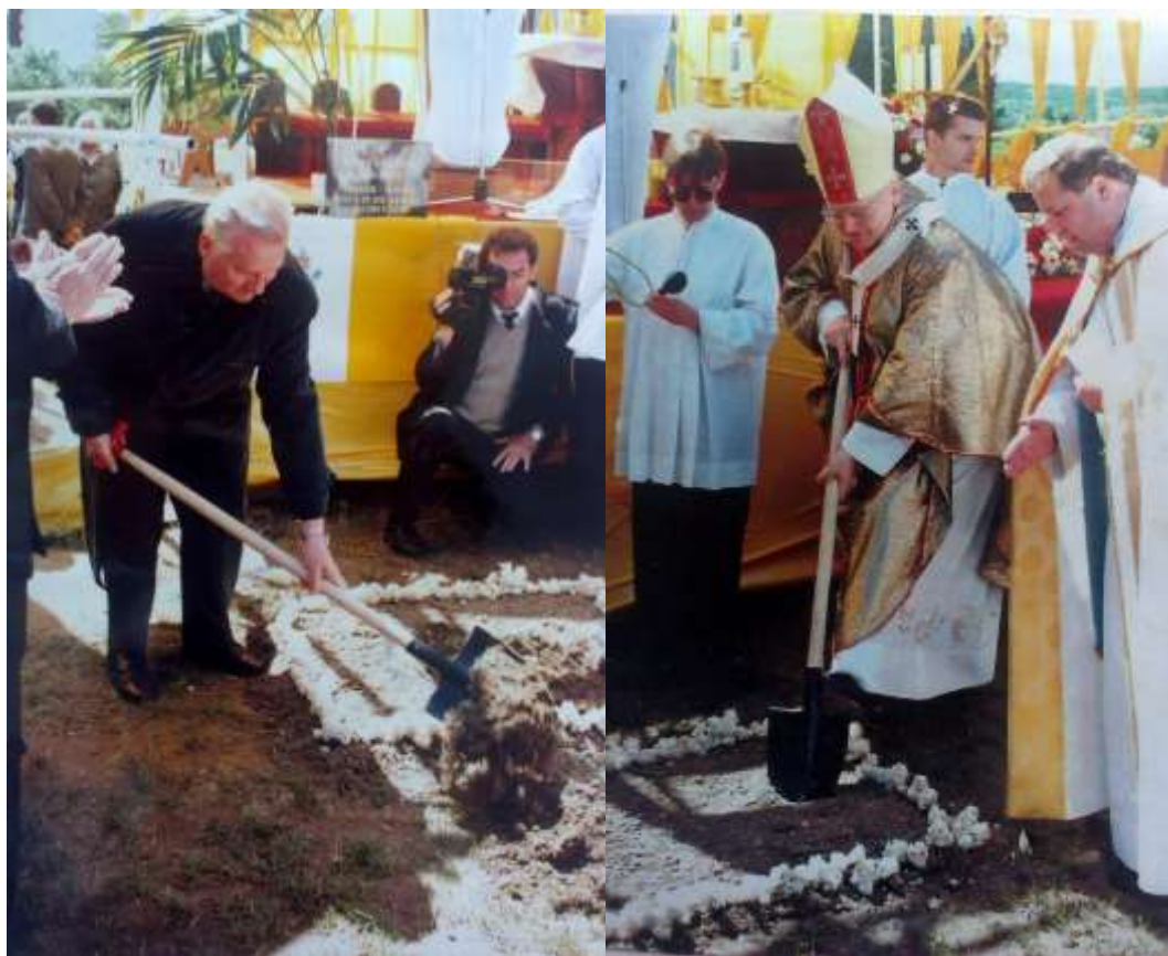
Zahájenie výstavby kostola, slávnostný výkop: prezident SR Michal Kováč, arcibiskup Mons. Ján Sokol, 25.5.1997