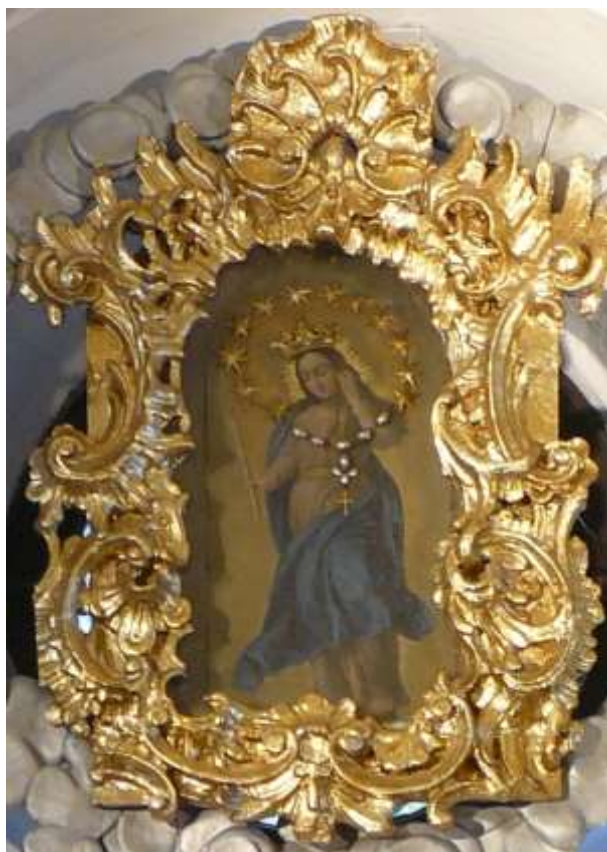
Oltárny obraz Ružencovej Panny Márie v súčasnosti.