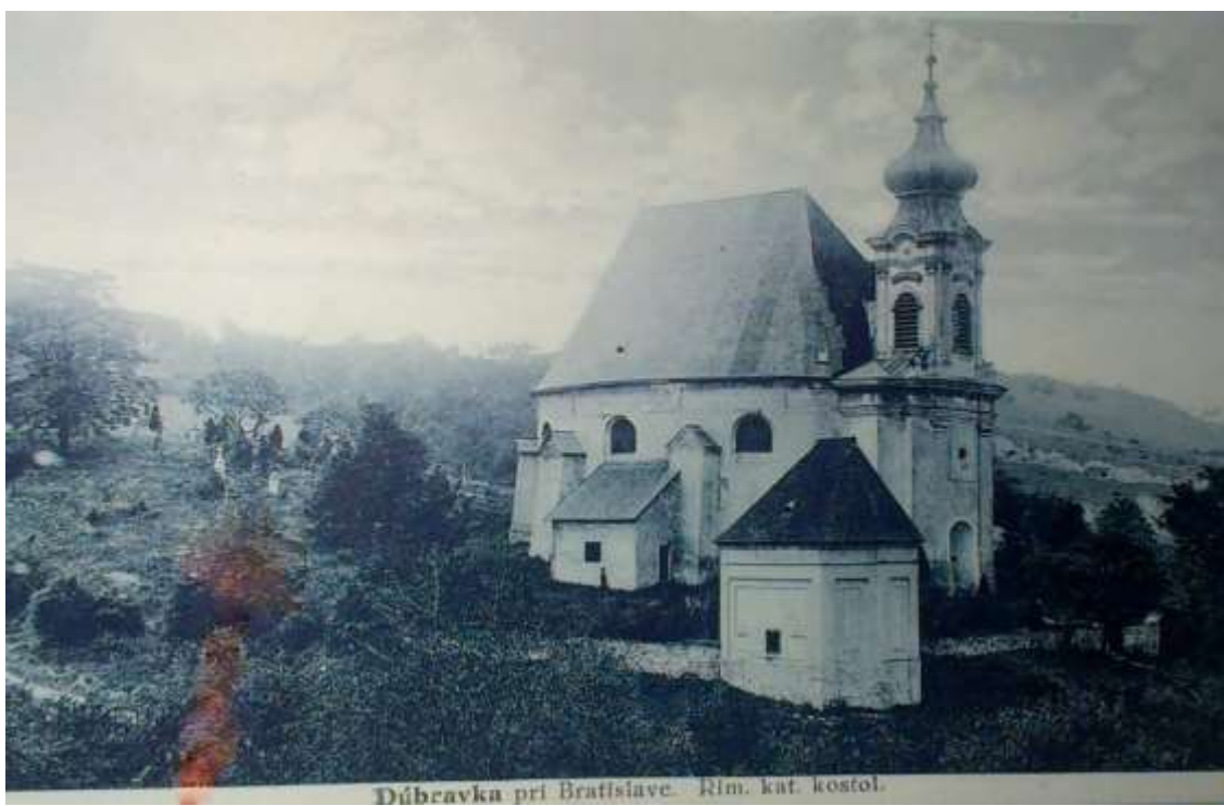
Kostol sv. Kozmu a Damiána, kaplnka Sedembolestnej Panny Márie na dobovej pohľadnici z 20-tych rokov minulého storočia.