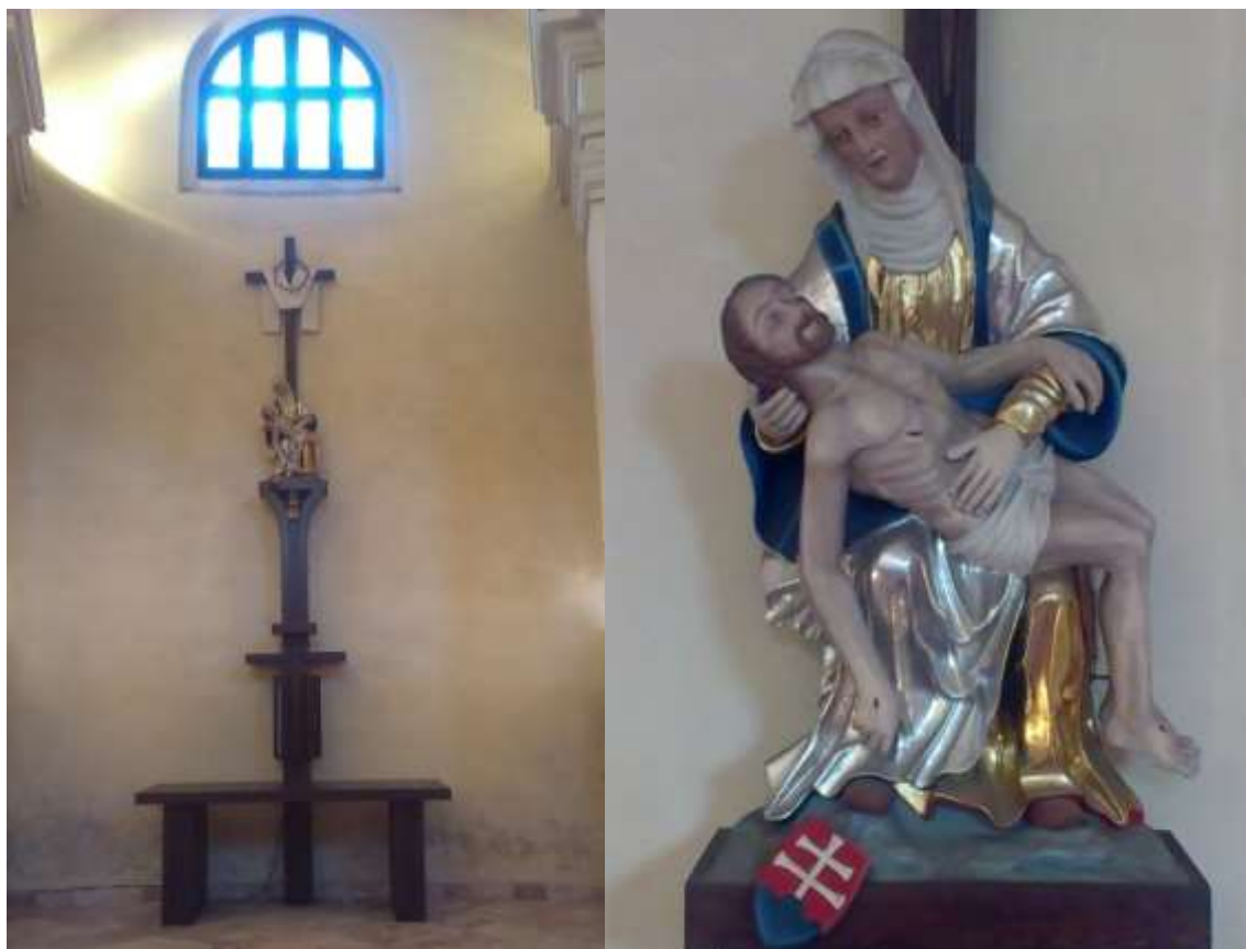
Súčasný bočný oltár Sedembolestnej Panny Márie. Plastika Piety bola do roku 1965 umiestnená v kaplnke Sedembolestnej Panny Márie.