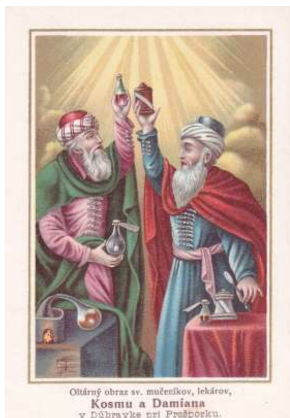
Dobový pamätný obrázok patrónov kostola, z 20-tych rokov minulého storočia.