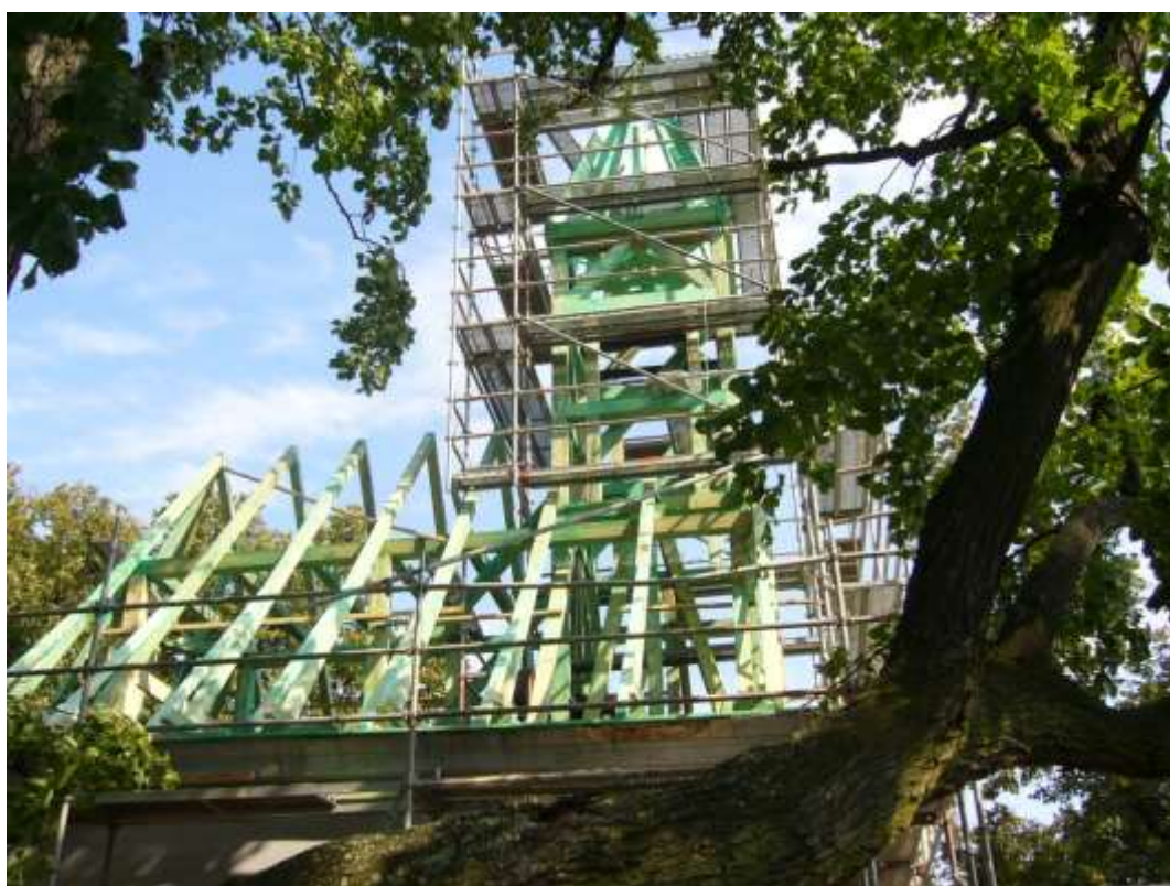
Nový krov a věža, september 2010