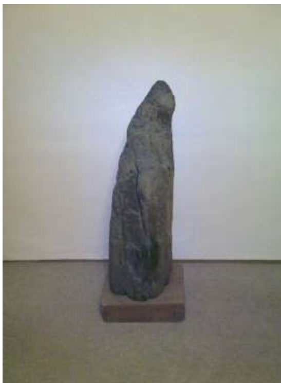
Fragment kmeňa planej hruškového je dodnes uložený za oltárom v kaplnke

Po architektonickej stránke je kaplnka zvyškom nedostaveného barokového kostola. Jej murovaná časť je jeho presbytériom. Miesto hlavnej lode bola dobudovaná len drevená prístavba. Má tri časti, Sakrálny priestor, sakristiu a predstavanú drevenú prístavbu.