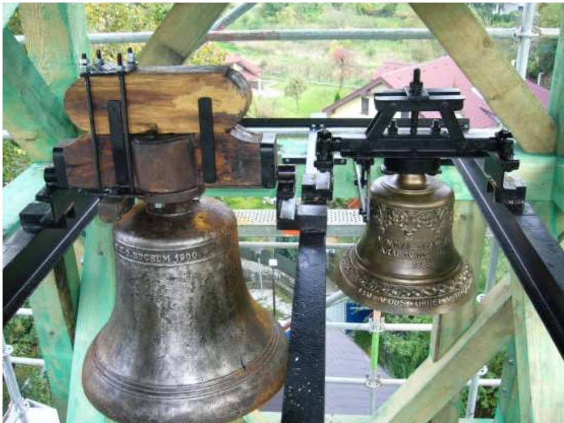
Zvony v novej veži už po oprave, október 2011