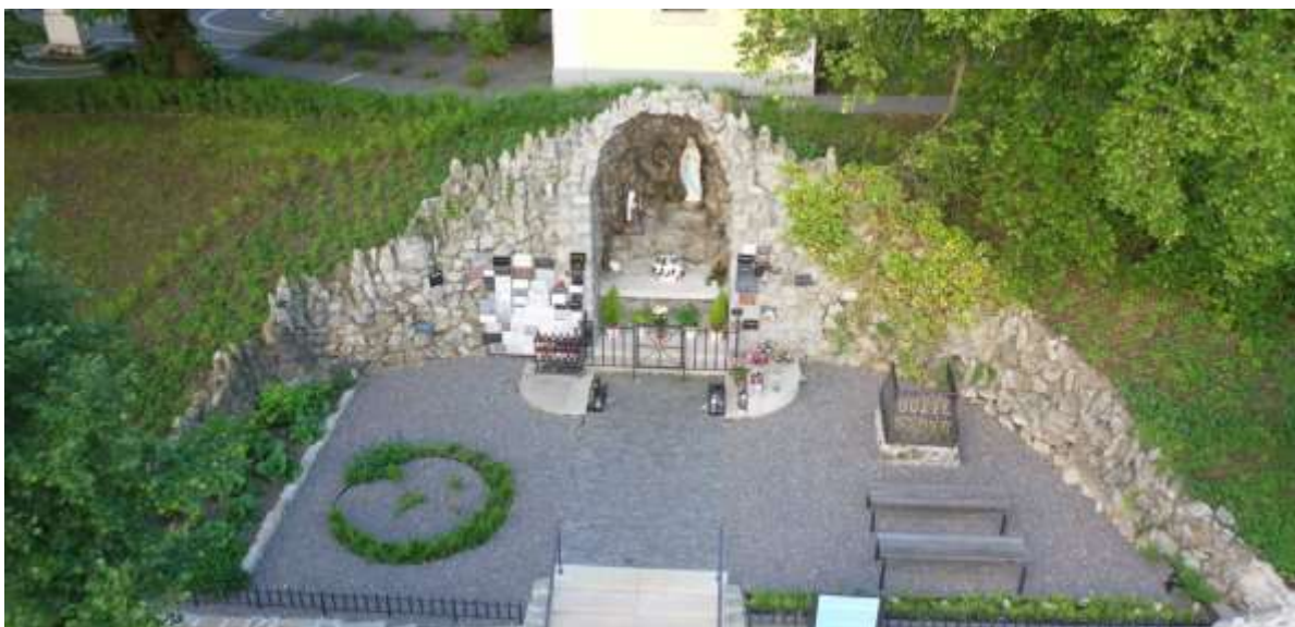
Lurdská jaskynka z roku 1948